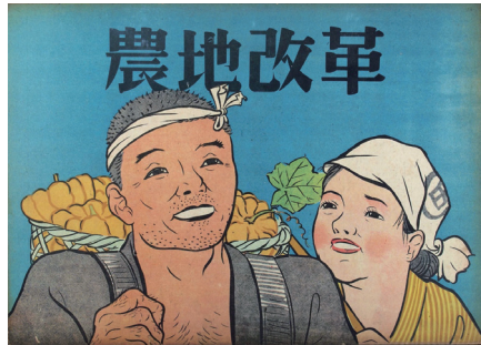
『農地改革』発行年、発行者不明、戦後