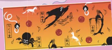
小泉八雲のスケッチによる妖怪手ぬぐい

事前申込不要です。直接会場へお越しください。県民の皆さまのご参加をお待ちしております。