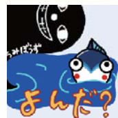
やいちゃん LINE スタンプ