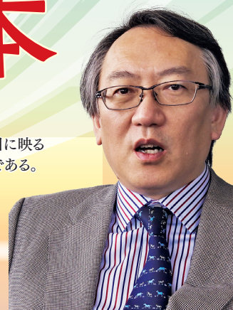
静岡県立大学 グローバル地域センター 特任教授